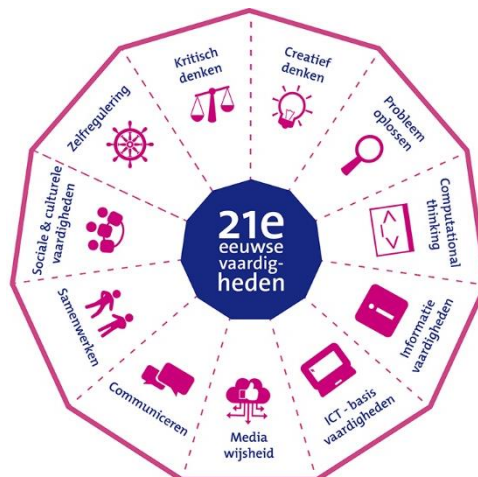
Het model voor 21e eeuwse vaardigheden zoals het is ontwikkeld door SLO en Kennisnet

Het gebruik van laptops biedt hiervoor heel wat extra mogelijkheden en kansen om de didactische doelen binnen de verschillende leerplannen te behalen. Daarnaast kan het ook helpen om belangrijke stappen te genereren in de ontwikkeling van de vaardigheden van de 21 ste eeuw .