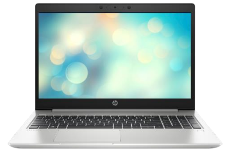
Afbeelding webshop Signpost